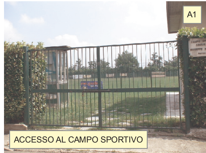
ACCESSO AL CAMPO SPORTIVO