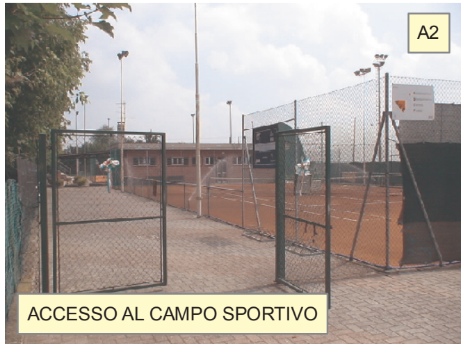
ACCESSO AL CAMPO SPORTIVO