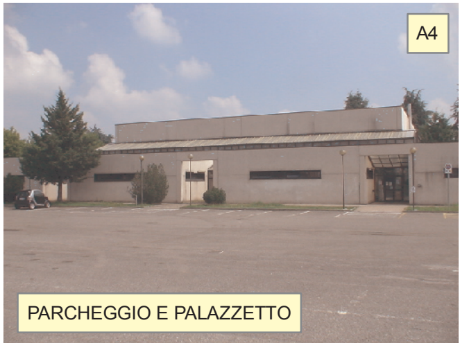
PARCHEGGIO E PALAZZETTO