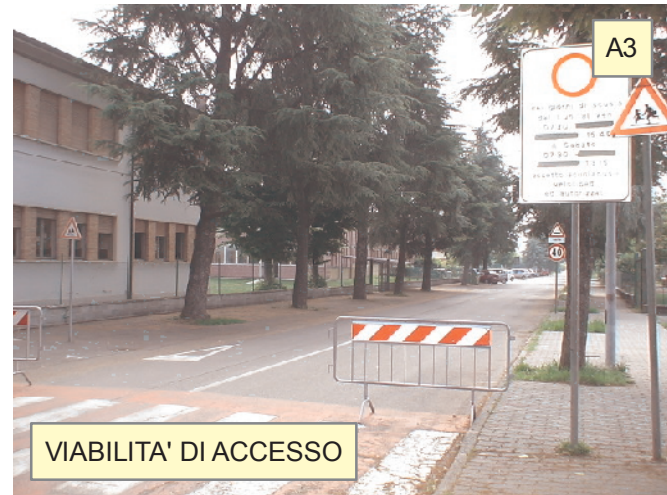
VIABILITA' DI ACCESSO