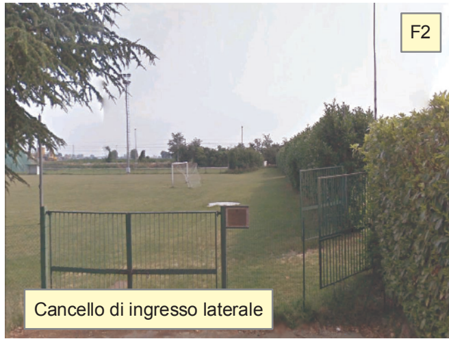
Cancello di ingresso laterale