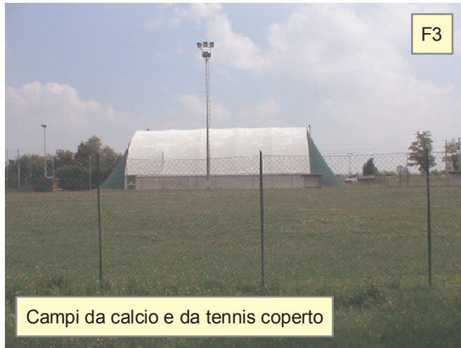
Campi da calcio e da tennis coperto