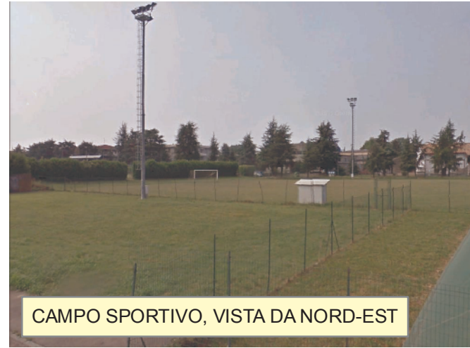
CAMPO SPORTIVO, VISTA DA NORD-EST