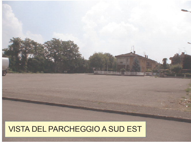
VISTA DEL PARCHEGGIO A SUD EST